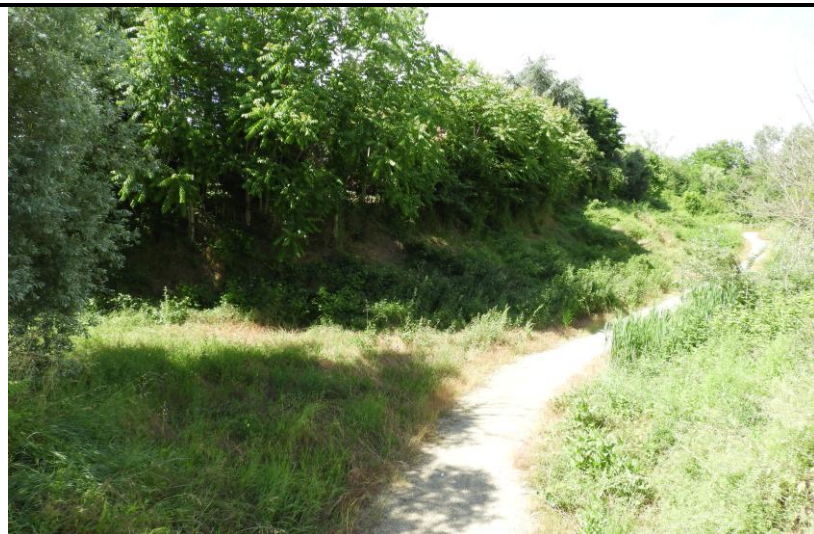
📍 Foto 5: Ripresa del tracciato ciclopedonale ER13 sul lato est in uscita dall'attraversamento in sottopasso