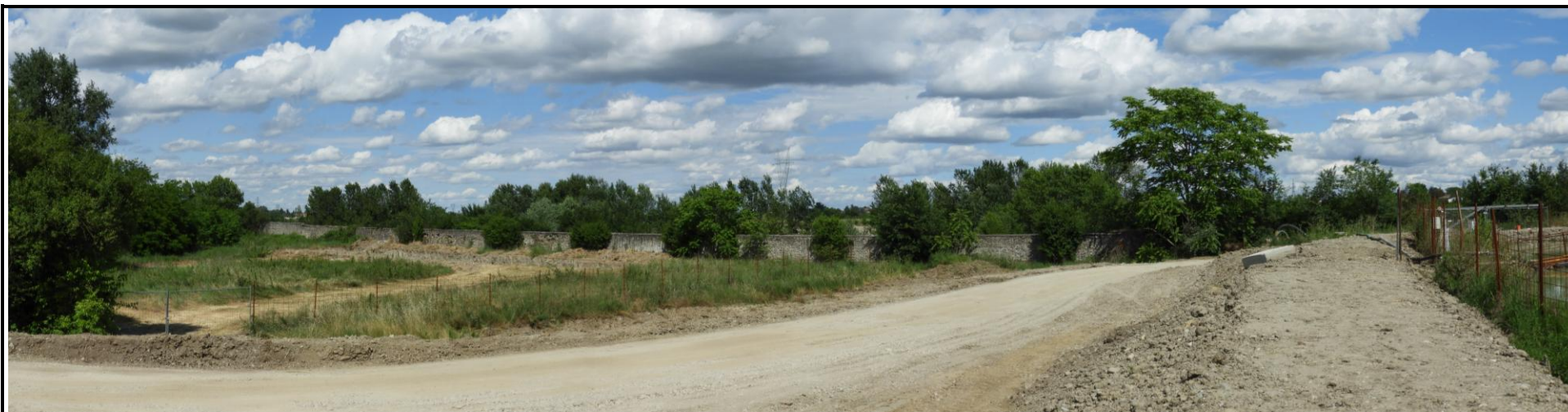
📍 Foto 1: Panoramica dell'area d'intervento ripresa dal lato sud sede della pista camionale, verso est Si noti sullo sfondo il muraglione e la presenza di rinverdimento spontaneo