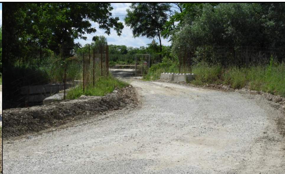
📍 Foto 4: Ingresso dalla Laterale di Via Reverberi e manufatto di attraversamento, in sovrappasso, della pista ciclabile