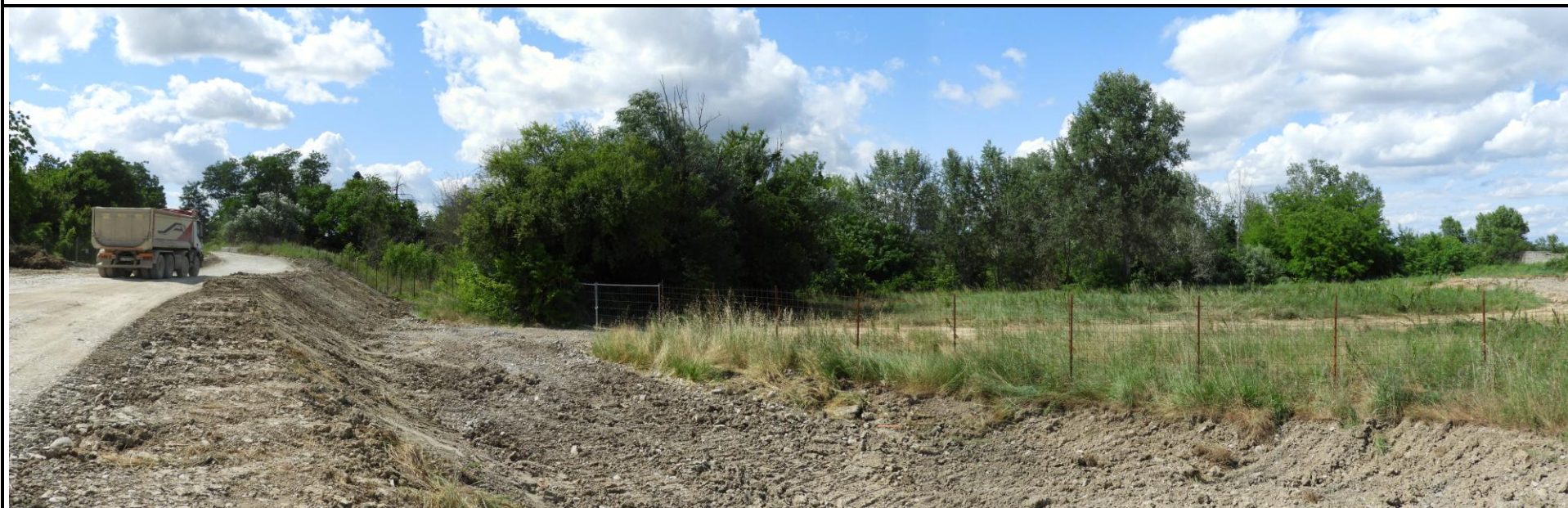
📍 Foto 2: Panoramica dell'area d'intervento ripresa dal lato sud sede della pista camionale, verso ovest